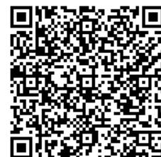
ホームページQRコード

http://www.osakafu-u.ac.jp/info/alumni/kikin/tax/